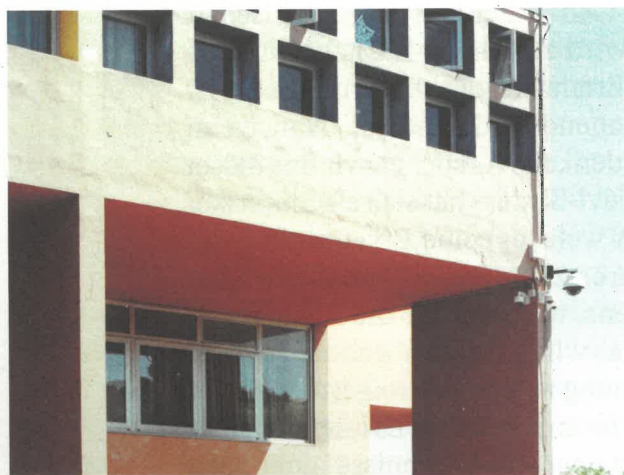
Campos Scolastica in Pesaro, Carlo Aymonino