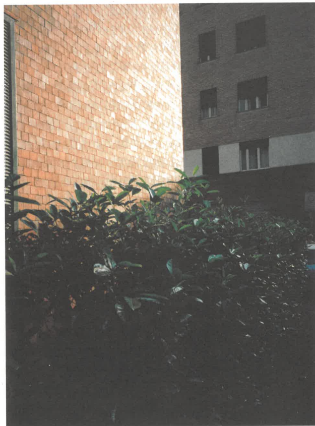
Edificio Borsalino Alessandria, Ignazio Gardella