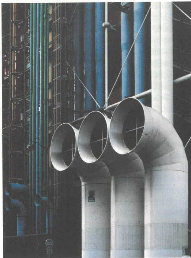
Centre Pompidou Paris, Renzo Piano/ Richard Rogers/ Gianfranco Francini