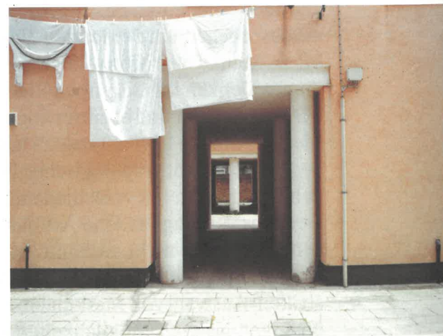
Via Giudecca Venedig, Aldo Rossi

dem Ideal sondern anhand realer Erfahrung. Junges Denken erweitert diese Idee um die prägende Dimension der Hoffnung. Obwohl diese durchwegs positiv konnotiert ist, bedingt sie immer erst eine Situation in welcher Veränderung herbeigesehnt wird. Die Hoffnung sollte also mit fortschreitender Erfahrung nicht schwinden, sondern wachsen: Wir begreifen ja gerade erst mit steigender Erfahrung, wie sich die Welt stets verändert und weiter verändern kann.