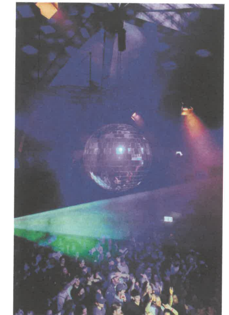
Vécsey*Schmidt: Kuppel, Basel Foto: Vécsey*Schmidt Architekt*innen, Pati Grabowicz