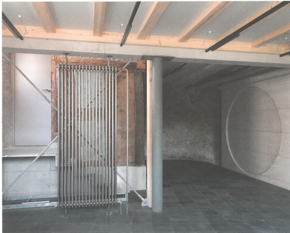
Kulturraum zur öffentlichen Nutzung (oben), offener Wohnraum (unten)