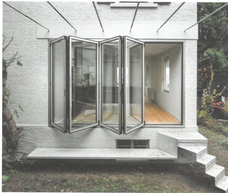
Das Gartenzimmer vor der Küche ergänzt die Wohnräume im Erdgeschoss.