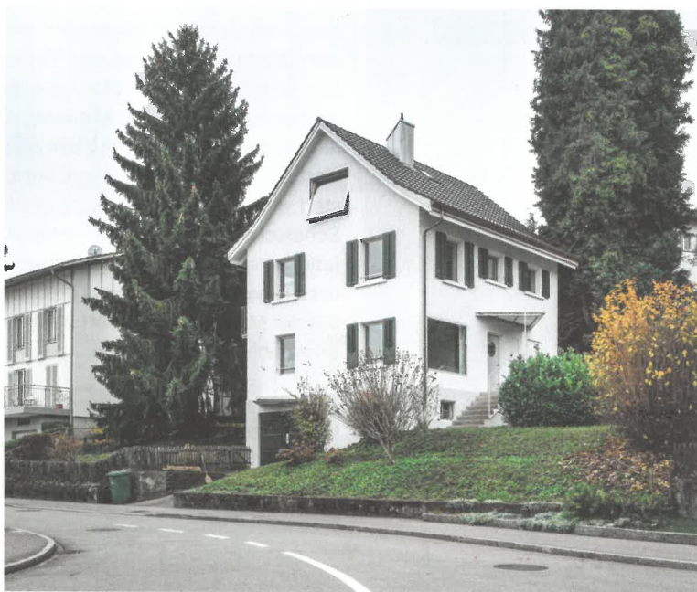
Erst auf den zweiten Blick erkennt man die Spuren des Umbaus in der Fassade.