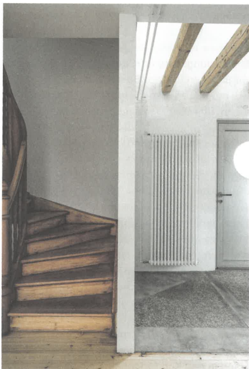
Innen treffen neue Raumhöhen und Materialien auf den alten Charme des Arbeiterhäuschens.